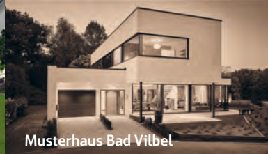
Musterhaus Bad Vilbel